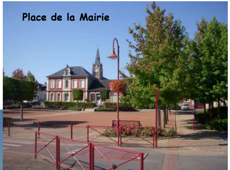
Place de la Mairie